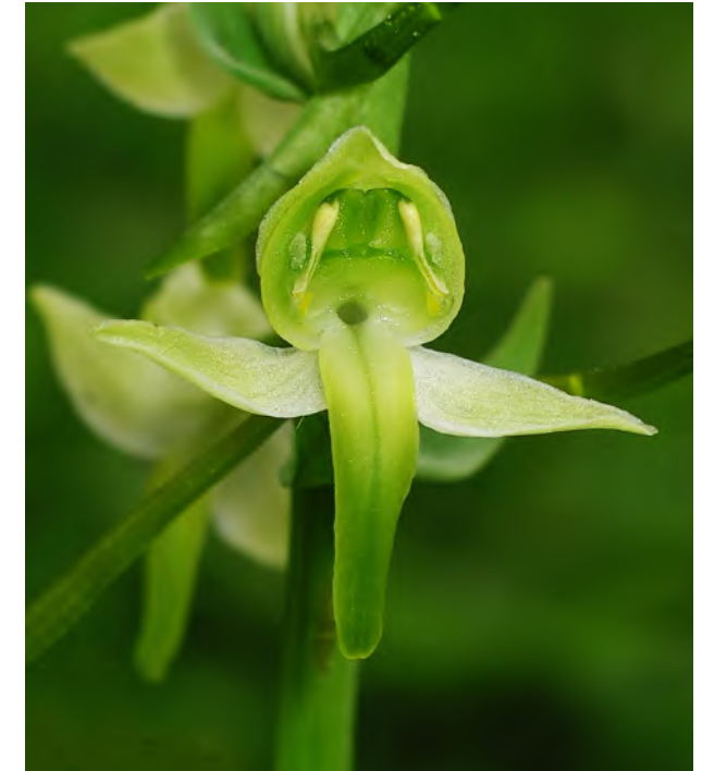
Einzelblüte. Gut zu sehen ist der Sporneingang, flankiert von den weit auseinander stehenden Antheren (Staubblättern)

Die Grünliche Waldhyazinthe ist feuchte- und kalkliebend und deshalb in der Jungmoräne auf den grundfeuchten lehmigen Platten zu finden. In den Mittelgebirgen tritt die Art zerstreut in Misch- und Buchenwäldern auf, ebenso wie an Waldrändern, auf Waldwiesen oder extensiv genutzten Weiden. In den Alpen steigt Platanthera chlorantha auf Bergwiesen und in lichten Kiefernwäldern bis 1700 m hinauf.