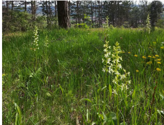
Lichter Kiefernwald mit Vorkommen der Grünlichen Waldhyazinthe

Die Blütezeit der Pflanzen ist abhängig von deren Höhenlage sowie dem Standort und liegt zwischen Mitte Mai und Ende Juli.