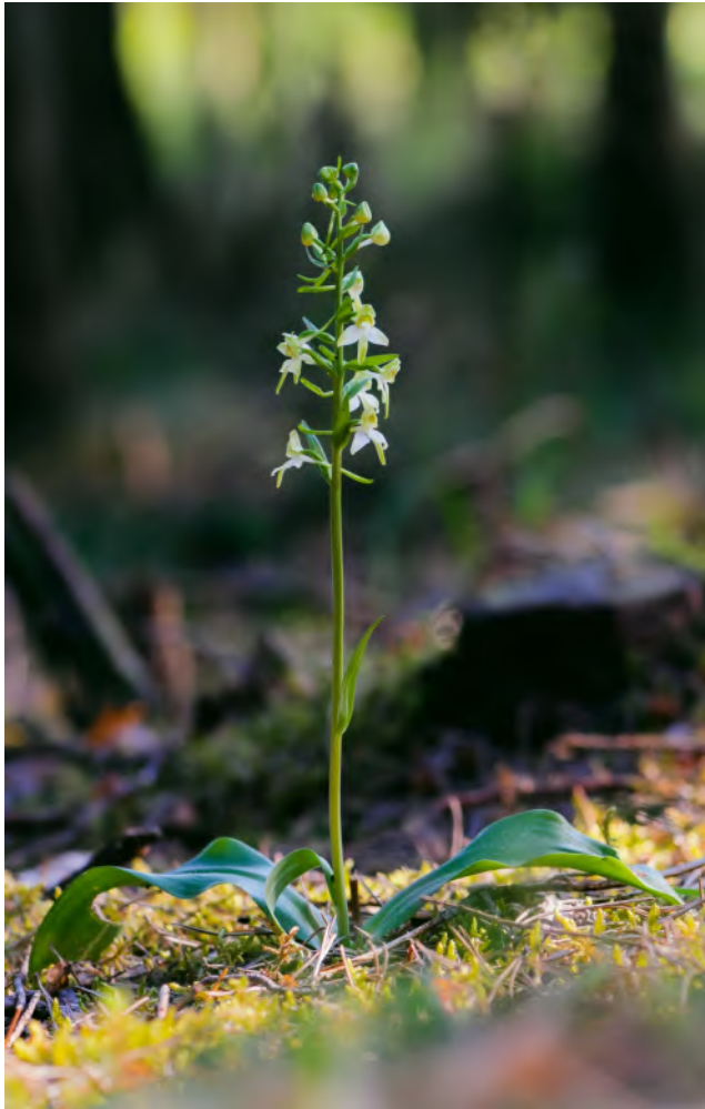
Habitus der Pflanze mit den weit ausgebreiteten Blättern

Für das Jahr 2025 wurde durch den AHO Deutschlands eine dezent erscheinende Pflanze zur Orchidee des Jahres erwählt. Die Grünliche Waldhyazinthe, oder auch Grünliches Breitkölbchen genannt, erhielt ihren Namen aufgrund der hellgrün schimmernden Blüten. Ihr Gattungsname deutet schon auf ein vermehrtes Vorkommen im Wald hin und verweist auf einen zarten Duft der Blüten. Stärker duftet die Weiße Waldhyazinthe, als Schwesternart sieht sie ihr sehr ähnlich und beide besiedeln diverse Habitate gemeinsam.